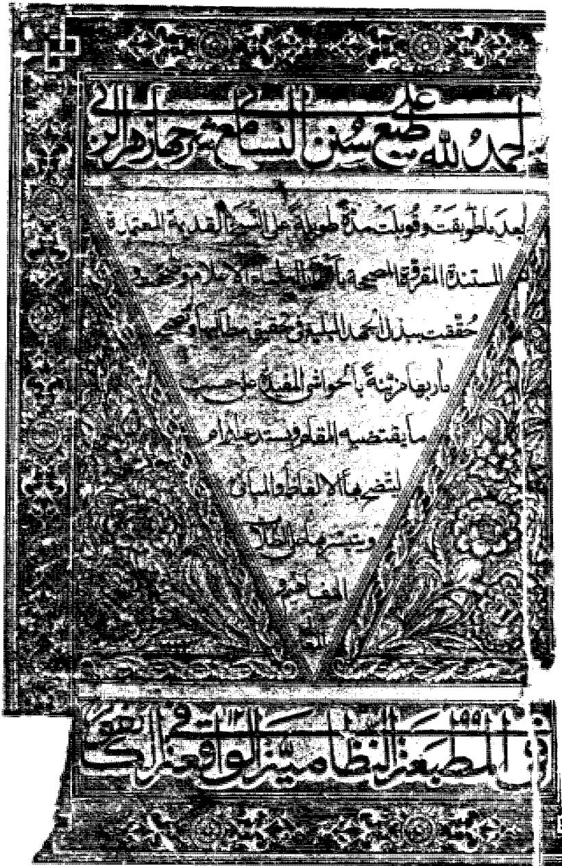
الغلاف الأول للنسخة النظامية