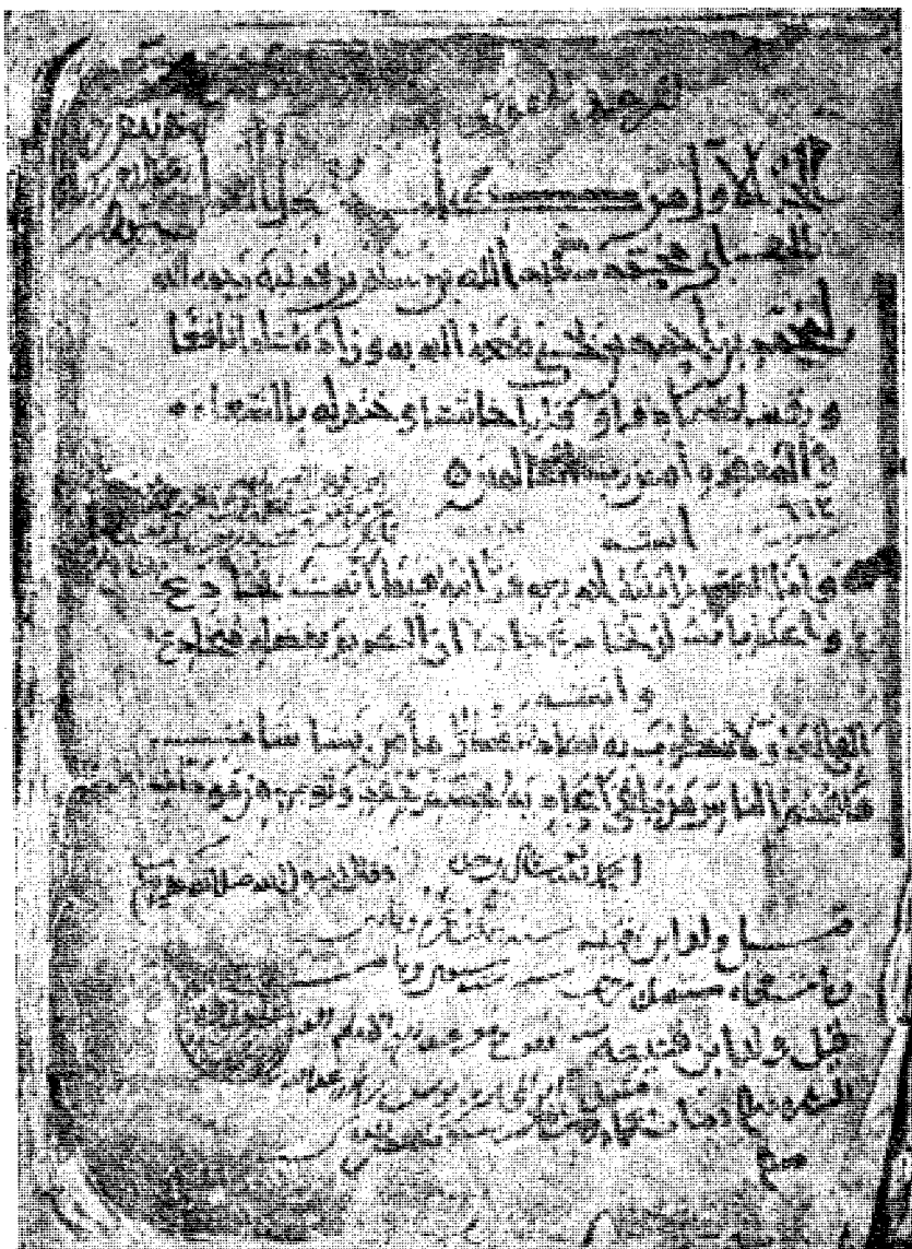
صورة الصفحة الأولى من النسخة الرموز إليها بحرف د د ،